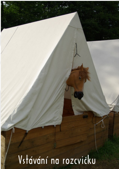
Vstávání na rozcvičku