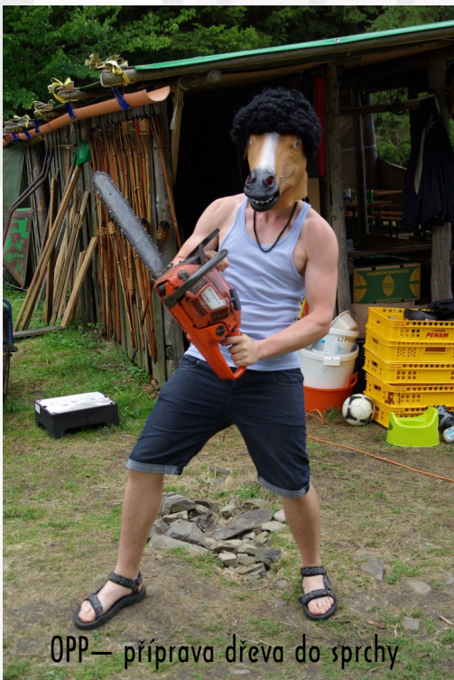
OPP— příprava dřeva do sprchy